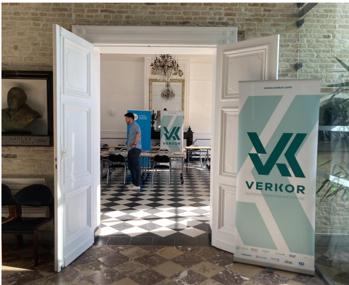
Photo de l'entrée de la salle où était installée la permanence, dans l'accueil de la mairie de Bourbourg.

Le public était ainsi libre de partager des observations générales et des observations sur d'autres thématiques, sans poser de question sur le projet lui-même.