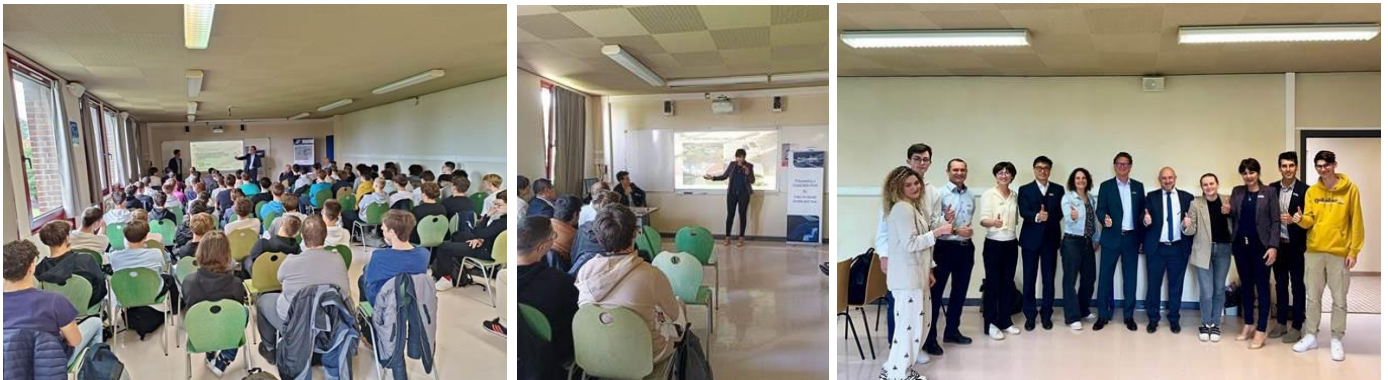
Photos de la rencontre au lycée de l'Europe le 23 mai 2024