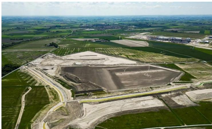
Vue drone du terrain d'implantation du projet – mai 2024

Dépôt du dossier d'autorisation environnementale (DDAE) et de la demande de permis de construire, annonce d'un partenariat stratégique (Schneider Electric), choix du lieu d'implantation du futur centre de recherche et développement... Des avancées majeures se sont concrétisées en ce mois de mai 2024. Fruits des efforts impulsés par nos équipes, elles viennent conforter la feuille de route du projet de gigafactory.