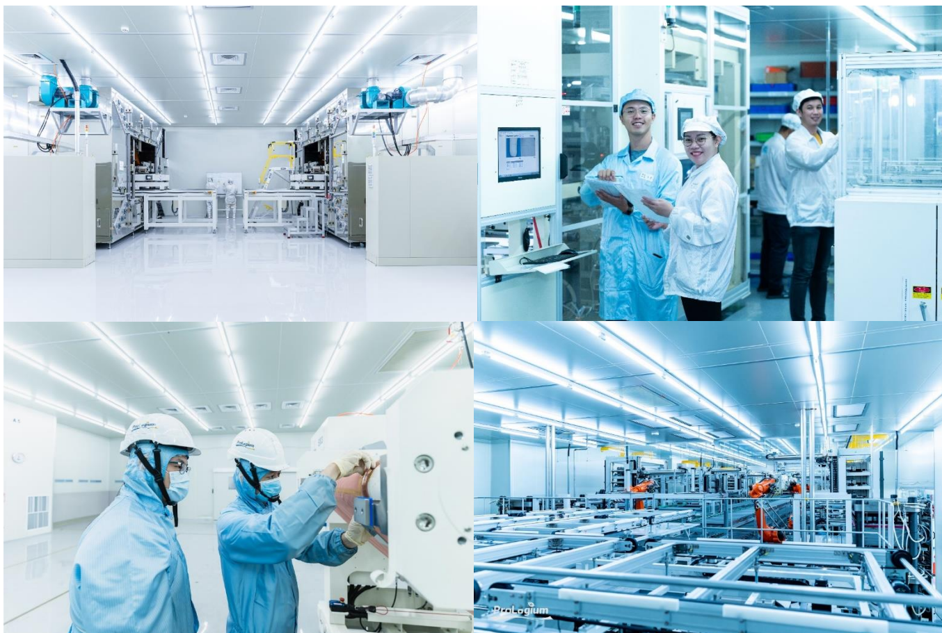
Photos des usines de fabrication de batteries ProLogium, 2023, Taiwan

L'accord national interprofessionnel du 19 juin 2013 la définit comme « un sentiment de bien-être au travail perçu collectivement et individuellement qui englobe l'ambiance, la culture de l'entreprise, l'intérêt du travail, les conditions de travail, le sentiment d'implication, le degré d'autonomie et de responsabilisation, l'égalité, un droit à l'erreur accordé à chacun, une reconnaissance et une valorisation du travail effectué. »