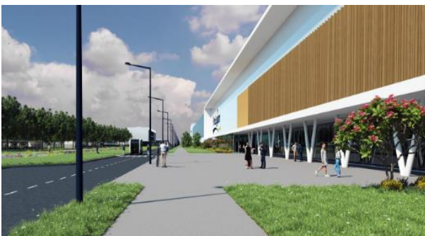
Projections 3D de la future usine de ProLogium sur le Grand Port Maritime de Dunkerque

L'obtention de cette certification est une démarche volontaire. Le niveau de certification recherché est « very well », soit l'échelle maximale. L'entreprise s'est imposée cette exigence afin d'inscrire son projet dans une démarche globale de recherche de durabilité.