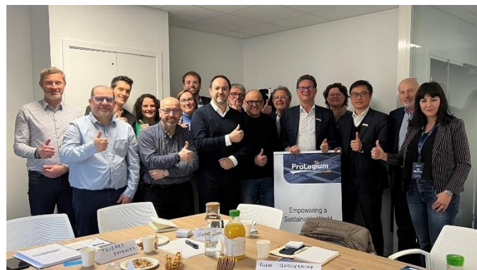
1 ère réunion du comité consultatif le 25 avril 2024