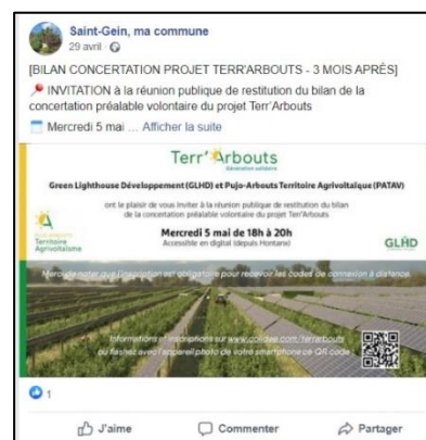
La publication Facebook de la commune de Saint-Gein relayant l'invitation à la réunion publique de restitution

Ce même courriel a été diffusé à la presse locale et spécialisée ainsi qu'aux responsables