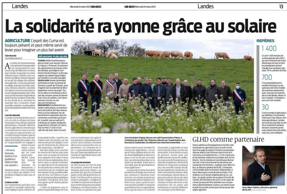
Claire Burckel (2021, 24 mars). « La solidarité rayonne grâce au solaire ». Sud Ouest, p.13.

Intitulé « La solidarité rayonne grâce au solaire », le premier article sur le projet Terr'Arbouts a été publié par le Journal Sud-Ouest le 24 mars 2021. Cet article relayait lui aussi les dates des prochaines réunions dont la date initiale de l'atelier dynamiques territoriales. L'article est accessible depuis ce lien : https://www.sudouest.fr/landes/castandet/landes-la-solidarite-entre-agriculteurs-rayonne-grace-au-solaire-1783233.php