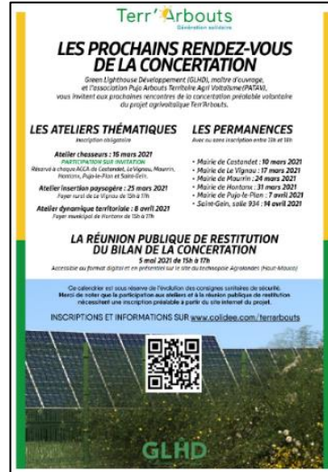
La note d'information « Les prochains rendez-vous de la concertation »

Un message d'accompagnement personnalisé à chacune des cibles invitait généralement à relayer l'information et à s'inscrire à ces rencontres répertoriées dans l'onglet « Événements » du site internet : colidee.com/terrarbouts , principale voie dématérialisée du projet où le public peut suivre son actualité.