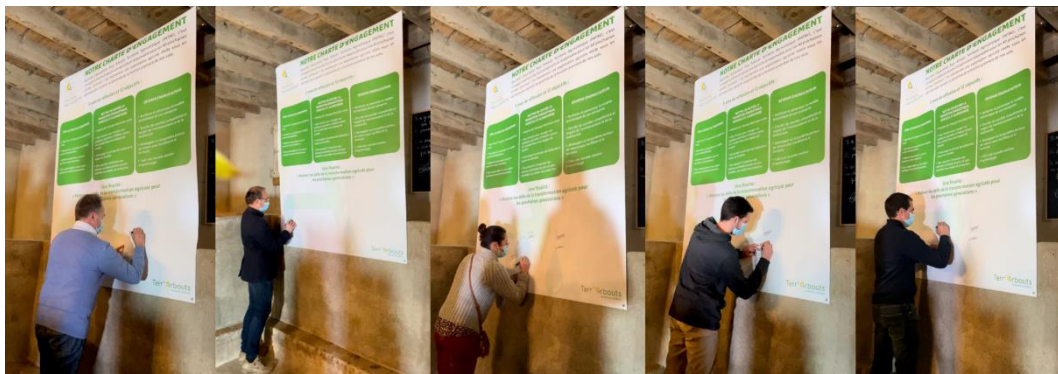
La signature de la charte d'engagement PATAV

Après avoir initiée la concertation préalable volontaire à Agrolandes (à Haut-Mauco), la concertation grand public a pris fin depuis le siège social de l'association PATAV. Ce choix a permis d'incarner le lancement du « mode projet » Terr'Arbouts. Plus particulièrement, une nouvelle étape dans la vie du projet a été officialisé et marqué par la signature en direct de la charte d'engagement des agriculteurs PATAV.