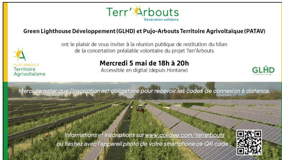
Le flyer d'invitation à la réunion publique de restitution du bilan de la concertation

Le 27 avril 2021, un courriel d'invitation pour assister à la réunion publique à distance a été envoyé à l'ensemble de la liste de diffusion. L'invitation était accompagnée d'un visuel créé pour l'occasion.